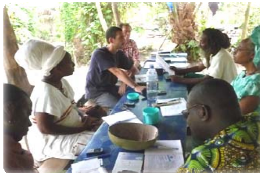
☞ Des "Amis de CREDI-ONG" assistent à une réunion de la FAEB au Bénin

* Les associations doivent avoir des activités s'insérant dans la promotion du développement durable.