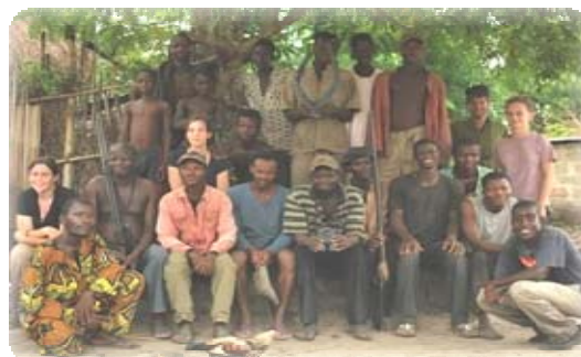
☞ "Des amis de CREDI-ONG" rencontrent des chasseurs de la Vallée du Sitatunga