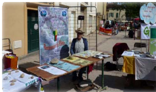
↳ Stand des "Amis de CREDI-ONG" au marché solidaire de Toulouges (66).

5. La promotion de ses services touristiques responsables et solidaires aux voyageurs en partance pour le Bénin.